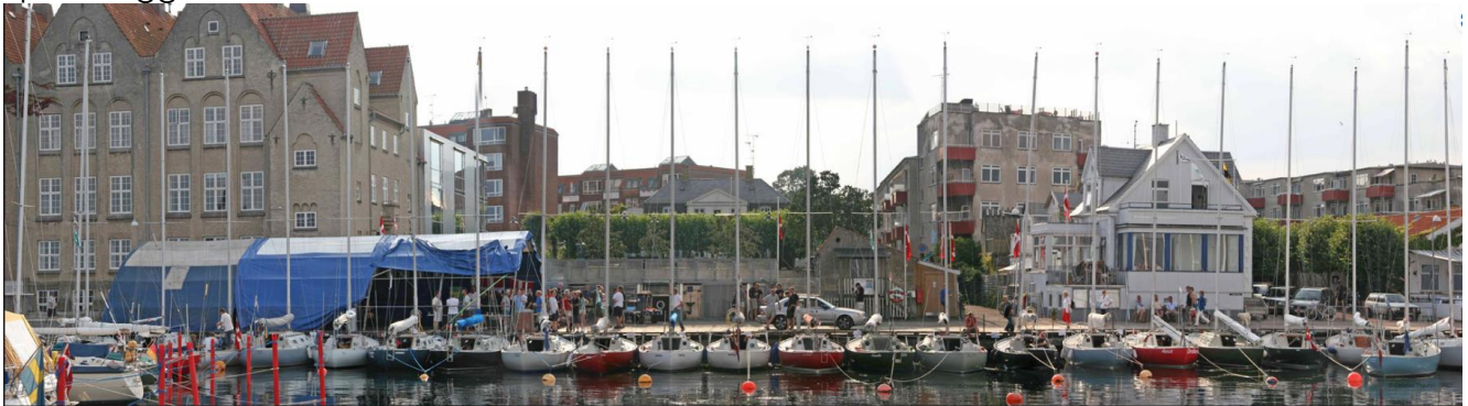
Spækhugger DM 2007 i Taarbæk