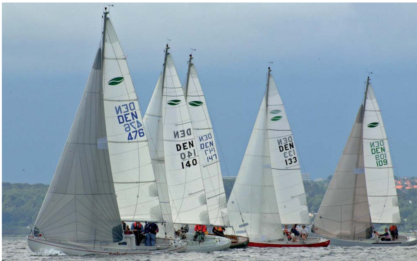
Start ved DM 2005 - Århus Bugt.

De nye klasseregler kan læses på www.spækhugger.dk under "båd data".